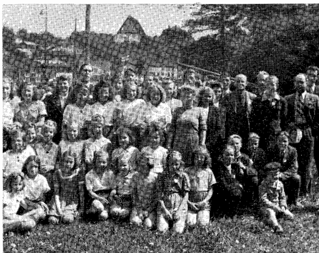
Piirijuhlajoukkue v. 1947.