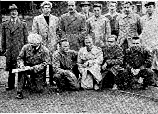
Joukkueemme seuraottelussa Haagan Hakaa vastaan 26. 9. 1954.