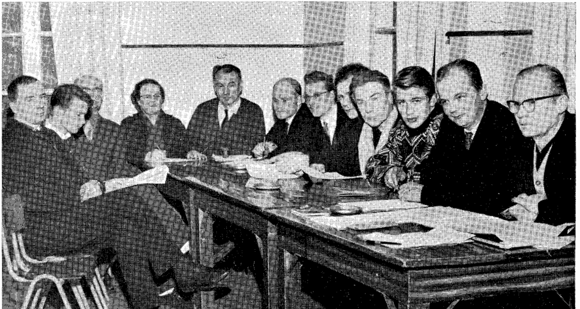
Visan nykyisen johtokunnan ja eri jaostojen jäseniä suunnittelemassa alkaneen vuoden toimintaa.